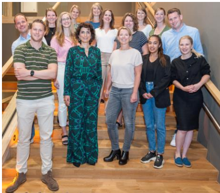
Regionale casuïstiekdag 2022

Een keer per jaar vindt een regionale casuïstiekdag plaats waar alle AIOS aanwezig zijn. Alle opleidingsziekenhuizen in de OOR presenteren 3 casus. De casus die vanuit Alrijne worden ingestuurd worden geselecteerd op de jaarlijkse lokale casuïstiekavond waar alle AIOS een casus presenteren en een publieksjury de beste 3 casus selecteert voor de regionale casuïstiekdag.